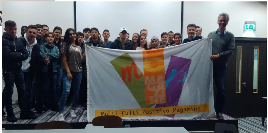
Zusammen mit dem Broeklandcollege aus Hoensbroek machen wir Aufnahmen von Rollenspielen im Arcuscollege in Heerlen und fahren wir zu der Firma Highlite in Kerkrade.