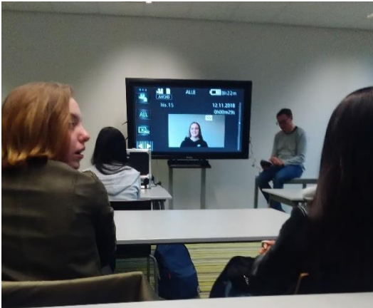
Ergebnisse werden gesichtet.